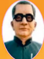
स्वतंत्रता सेनानी राम मनोहर लोहिया