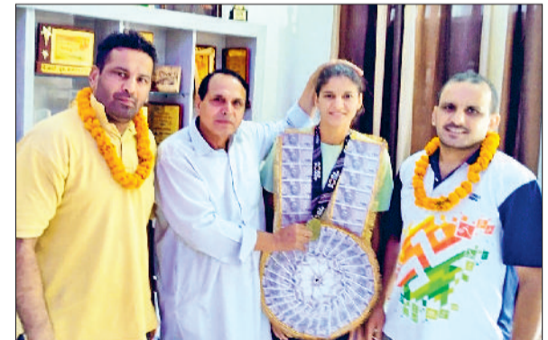
भिवानी। पदक विजेता को सम्मानित करते हुए।