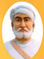
दानवीर सेठ भामाशाह