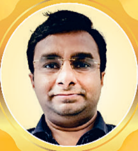
राजीव मित्तल सागर ट्रेवल मार्ग भिवानी