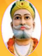
हेमचंद्र विक्रमादित्य महापुरुष दिल्ली के अंतिम हिन्दू सम्राट