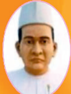
स्वतंत्रता सेनानी सेठ जमनालाल बजाज