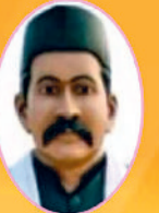
प्रमुख साहित्यकार बालमुकुन्द गुप्ता