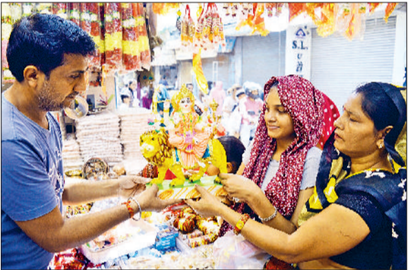
मिवाणी। सराय चौपाटा स्थित दुकान पर नवरात्र की पूजा अर्चना का सामान खरीददती महिलाएं।

शारदीय नवरात्र 22 सितंबर से शुरू होकर एक अक्टूबर बुधवार को संपन्न होंगे और शहर के सभी मंदिर जगत जननी माता रानी के जयकारों से गूंजायमान होंगे। इस बार माता रानी हाथी पर सवार होकर पृथ्वी लोक पर पधारेंगी, जो धार्मिक मान्यताओं के अनुसार श्रुत संकेत हैं। 22 सितम्बर सोमवार को हस्त नक्षत्र, ब्रह्म योग एवं सवार्थ सिद्धि योग है। 22 को सुबह 6:27 से 8:16 बजे तक 1 घंटा 49 मिनट कलश स्थापना का शुभ मुहूर्त और दोपहर 12:07 से 12:55 तक 48 मिनट अभिजीत मुहूर्त रहेगा। इस बार माता रानी हाथी पर सवार होकर पृथ्वी लोक पर पधारेंगी, जो धार्मिक मान्यताओं के अनुसार श्रुत संकेत हैं। 22 सितम्बर सोमवार को हस्त नक्षत्र, ब्रह्म योग एवं सवार्थ सिद्धि योग है। 22 को सुबह 6:27 से 8:16 बजे तक 1 घंटा 49 मिनट