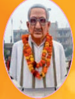
अशोक सिंघल अंतर्राष्ट्रीय अध्यक्ष VHP