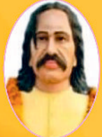
भारतेन्दु हरिश्चन्द्र प्रसिद्ध साहित्यकार