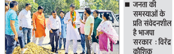
भिवानी। अधिकारियों को दिशा निर्देश देते हुए।

उन्होंने लोगों की शिकायतों को सुना और तुरंत ही जनस्वास्थ्य अभियांत्रिकी विभाग के अधिकारियों को समस्या का समाधान करने के निर्देश दिए। बता दें कि विजय नगर निवासी पिछले