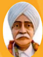
शेरे पंजाब लाला लाजपतराय