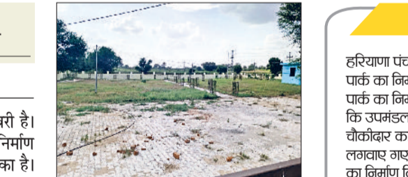
भिवानी। कस्बे में निर्माण किया गया स्वर्ण जयंती पार्क।

पार्क का डिजाइन आमजन की सुविधाओं को ध्यान में रखकर तैयार किया गया है, ताकि बच्चों से लेकर बुजुर्गों तक सभी इसका लाभ