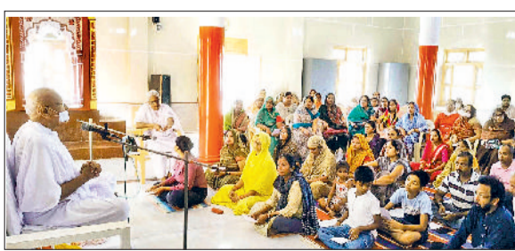
हलुवास गेट फाटक पर स्थित जैन मुनि आश्रम में मंत्र जाप कार्यक्रम का आयोजन

स्तुति की गई। इस पाठ के करने से दुःख दूर होते हैं, यश एवं सम्मान बढ़ता है तथा मनवांछित कामनाएं पूरी होती हैं। वहीं नकारात्मक ऊर्जा और संकट दूर होते हैं। ये बात हलुवास गेट फाटक पर स्थित जैन मुनि आश्रम में मंत्र जाप कार्यक्रम का आयोजन